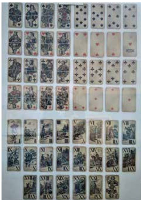
Taroky z roku 1880